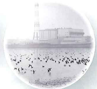
平成3年の藤前干潟