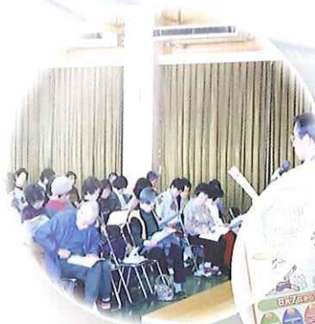
新資源収集開始に伴う 市民への広報・啓発