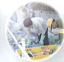
分別・リサイクルに 取り組む市民