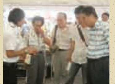
河村市長とカメ談義

9月18日、久屋大通公園で行われた「環境デーなごや2011」の会場で、名古屋で見られる生きものの展示や活動の紹介をしました。