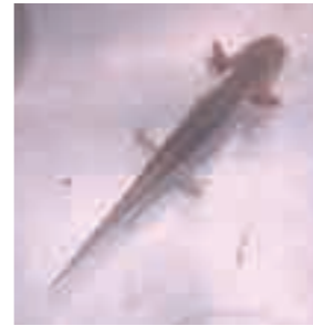
カスミサンショウウオの幼生

そこで、今年度、「名古屋アライグマ防除実施計画」を策定し、7月に東海農政局長及び環境省中部地方環境事務所長の確認を受けました。今後も、総合的・体系的にアライグマの生息状況と被害の実態調査を進め、防除を実施していきます。