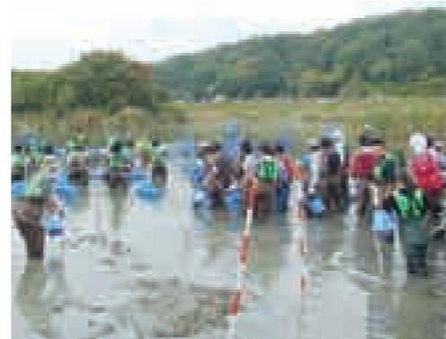
大根池の池干し(11月3日)

さらに、過去に池干しによる調査を実施した池についても、その後の変化を追跡調査しています。緑区竜池ではヒメガマが蘇り、昭和区単人池ではモツゴが大繁殖し、守山区雨池では水生植物のヒシが復活しました。今後も、継続的にモニタリングを実施していきます。