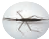
ヒメミズカマキリ