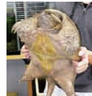
扇川のカミツキガメ