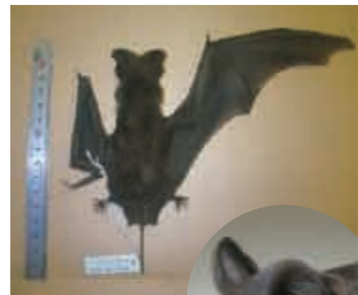
尾と顔に特徴のあるオヒキコウモリ