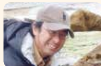
吉田英一 博士 名古屋大学博物館 館長・教授