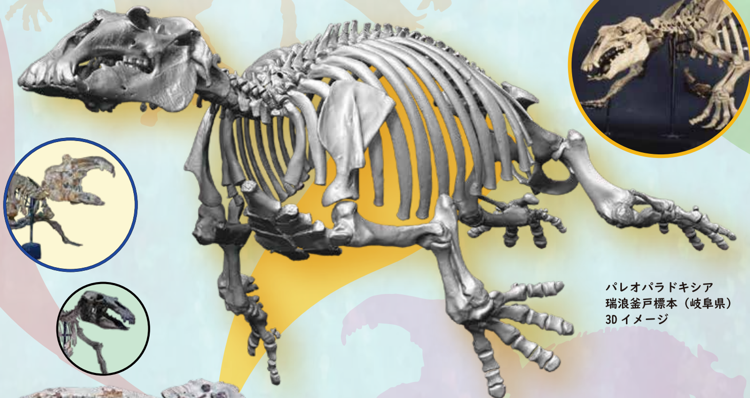
パレオパラドキシア 瑞浪釜戸標本（岐阜県） 3D イメージ