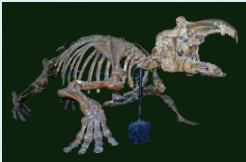
大野原標本（埼玉県） 埼玉県立自然の博物館所蔵