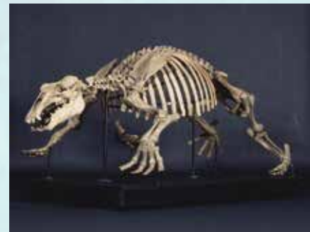
梁川標本（福島県） 福島県立博物館所蔵

本展では、日本で見つかった頭骨を含むパレオパラドキシア骨格標本の梁川標本、大野原標本、津山標本を展示します。各地の博物館から一堂に集まったパレオパラドキシアの骨格は圧巻です。