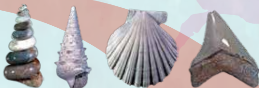
博物館収蔵の貴重な瑞浪産化石も展示