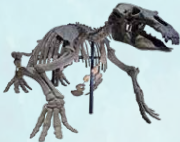
津山標本（岡山県） 豊橋市自然史博物館所蔵