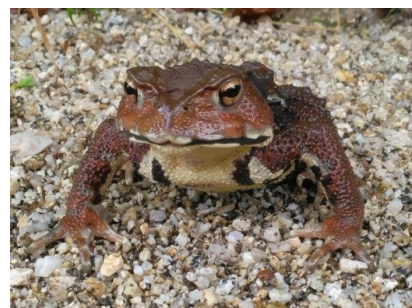
アズマヒキガエル