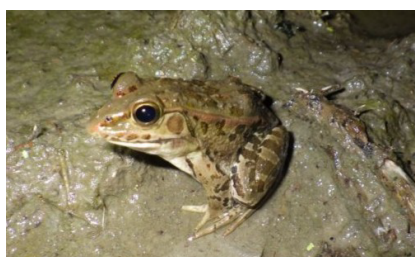
ナゴヤダルマガエル