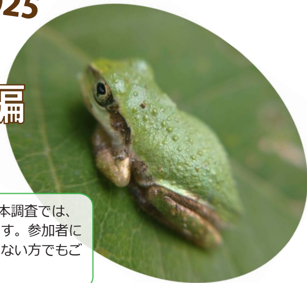
ヒガシニホンアマガエル

名古屋市内には 11 種類のカエルがいます。本調査では、鳴き声の録音により、市内のカエルの分布状況を明らかにします。参加者には調査方法を記載した資料を配付しますので、カエルに詳しくない方でもご参加いただけます。