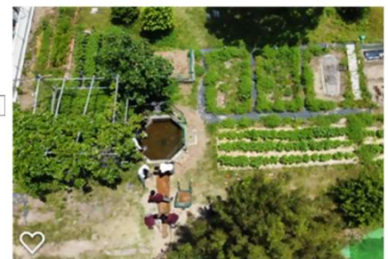
学校ビオトープ（市邨高校）