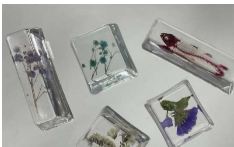
透明標本（東邦高校）